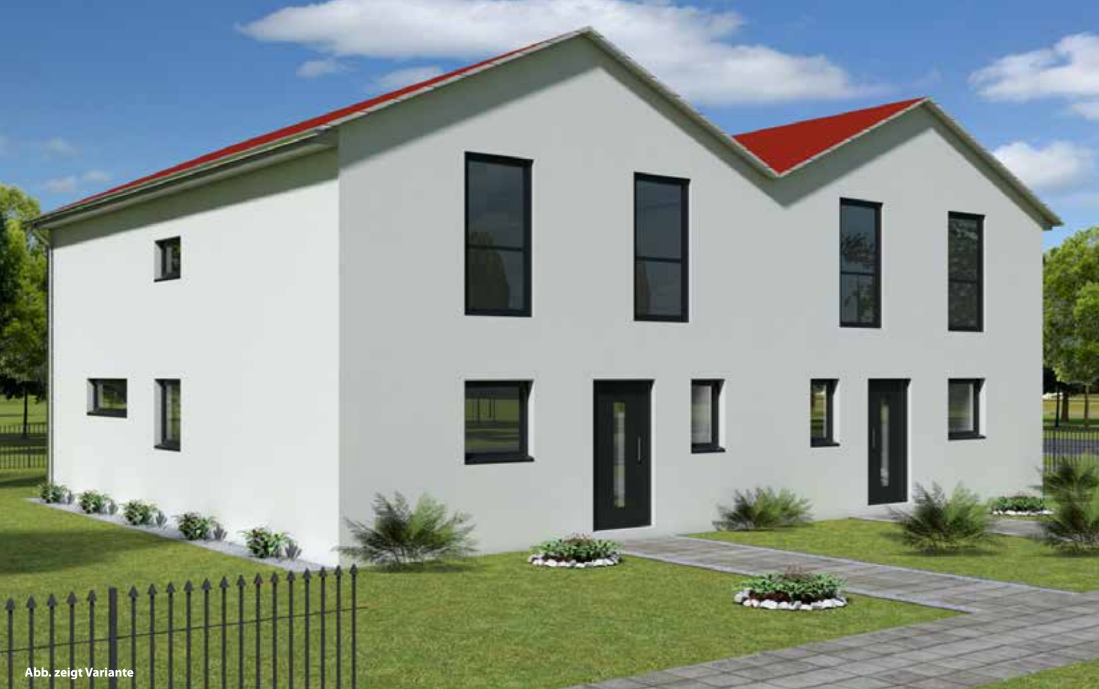
Abb. zeigt Variante

Das Bauvorhaben liegt direkt an der Hafestraße in Schwülper-Walle.