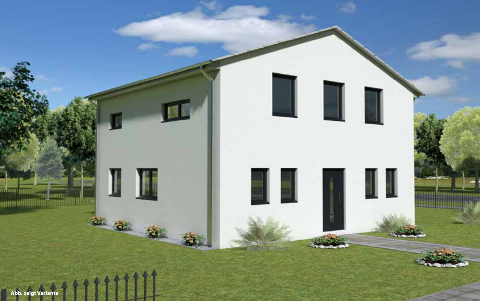
Abb. zeigt Variante

Das Bauvorhaben liegt direkt an der Hafensstraße in Schwülper-Walle.