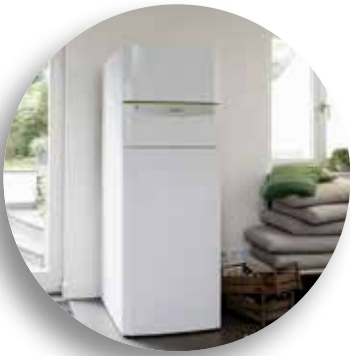
Luft/Wasser-Wärmepumpe flexoCOMPACT exklusive