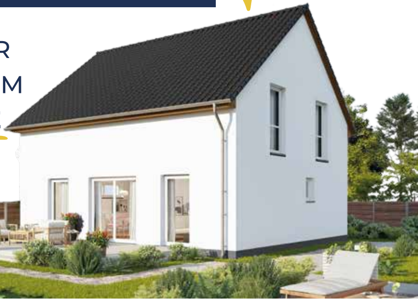
Abbildung zeigt Variante

MIT UNS KÖNNEN SIE FÜR 8€ PRO M 2 UND MONAT IM BAUGEBIET HONDELAGE IHR EIGENHEIM BAUEN!